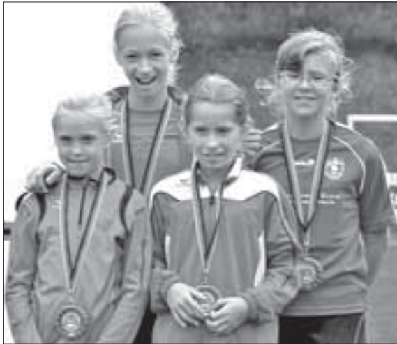
Unsere 4x50m Staffel

Herzlichen Glückwünsche allen Teilnehmer unseres Vereins Rot-Weiß Werneuchen.