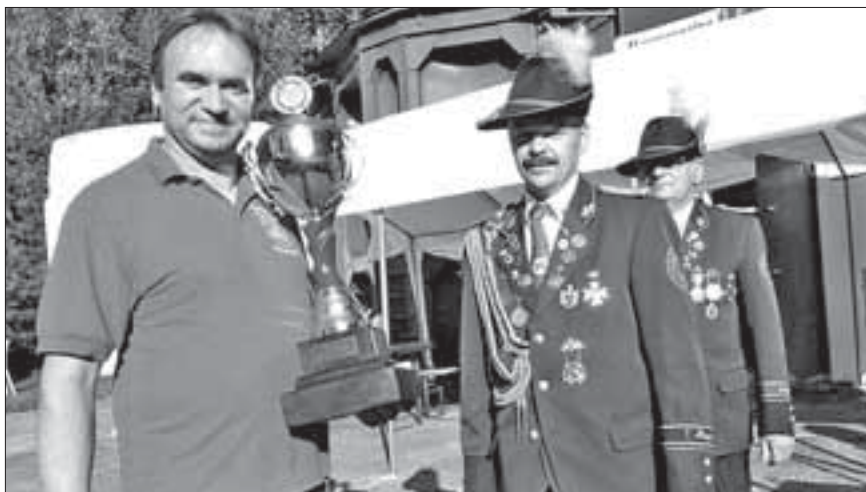
Sieger beim Wettkampf Vereine und Betriebe