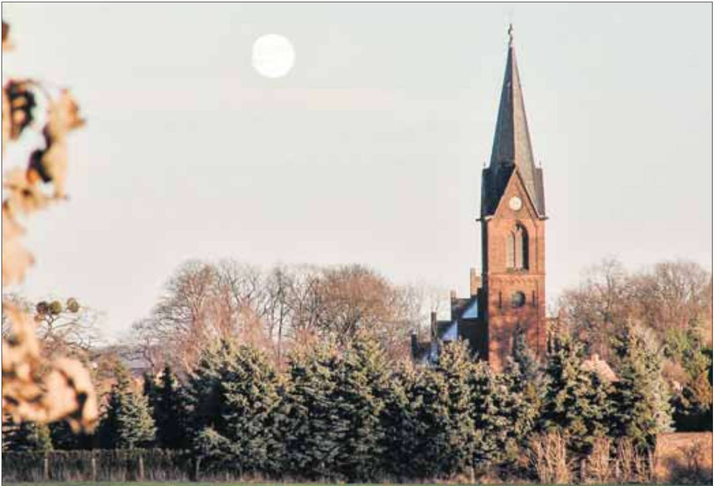
Blick auf das herbstliche Werneuchen