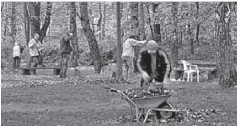
Einige der fleißigen Helfer bei der Arbeit