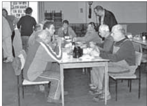
...und dann beim wohlverdienten Imbiss