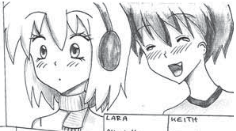
LARA Alter: 14