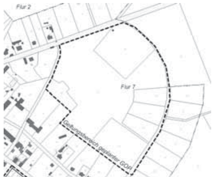
Geltungsbereich des geplanten Grünordnungsplanes (GOP) „Park am ehemaligen Gutshaus Hirschfelde“